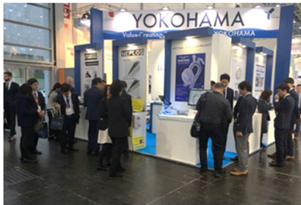
【参考】COMPAMED2019 横浜パビリオン