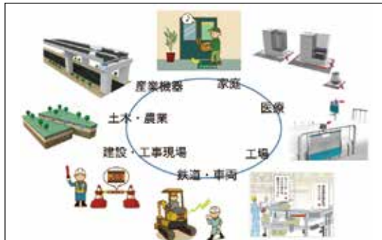
開発事例の製品分野