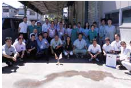
社員集合写真（コロンビア視察団来社時）

IoTの時代に応えるべく、様々な業種に対応するセンサー、スイッチの技術で未来を拓きます。