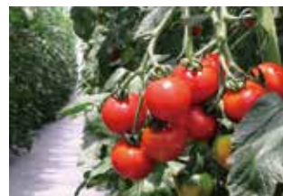
弊社システムを使用して栽培したトマト