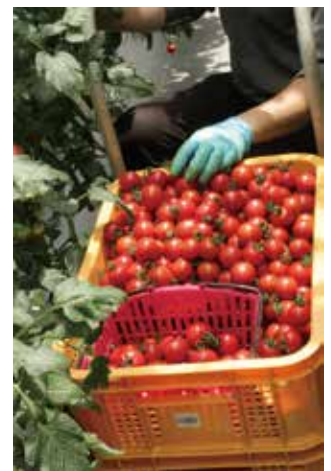
弊社開発農場にて実験栽培を行っております。