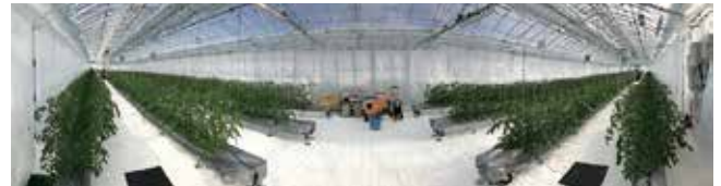
トマト栽培農場（顧客例）