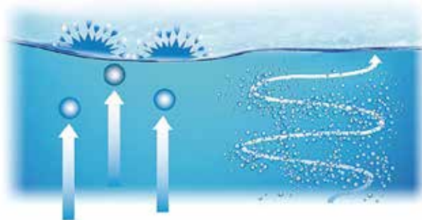
液中での滞留時間が長く高い分散性