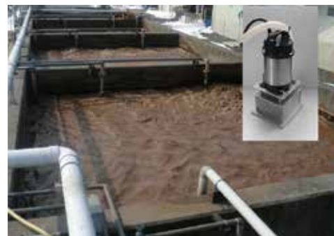
排水処理風景とスマートバブラー