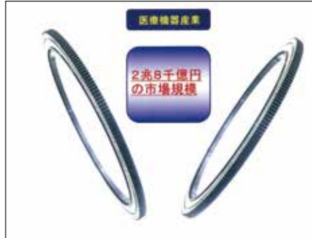
生化学分析器用ギア一体型軸受