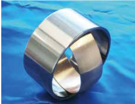
シェールガス・オイルを求めて海底 3000m

INNOVATION との出会いこそが、ご納得のブランドとの共演（コラボ）です！ そこに、目指す未来がやって来る！