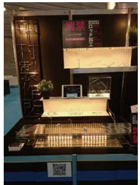
2016年度のテクニカルショウヨコハマに初出展