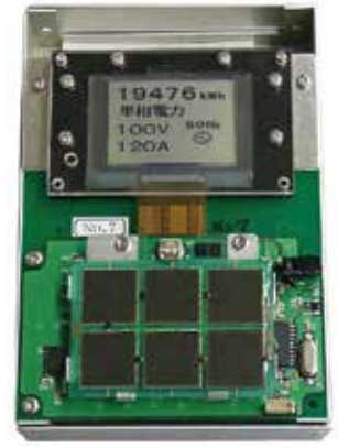
電子ペーパー駆動装置