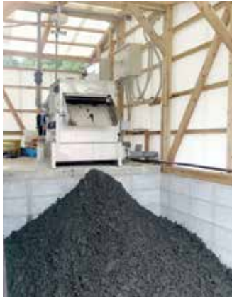
SPATON 脱水機 LX シリーズ

当社独自の目詰まりしない・洗浄水を使用しない固液分離技術である【SPATON テクノロジー】を搭載した污泥脱水機を中心に、畜産汚水やコンビニ食材加工場などから発生する産業廃棄物である污泥の減容化することで社会貢献できます。