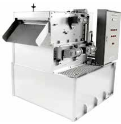
SPATON 脱水機 RZ シリーズ