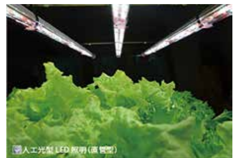
人工光型 LED 照明 (高効率)