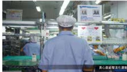
真心直結型生産体制