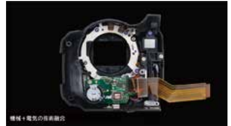
機械+電気の日産組立