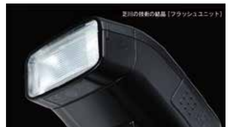
芝川の技術の結晶「フラッシュユニット」

カメラ用ストロボ、フラッシュライト、エレクトロニクス製品、ヘルスケア製品、防災製品