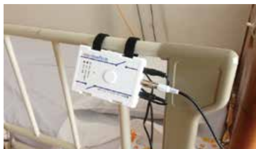
施設における設置例