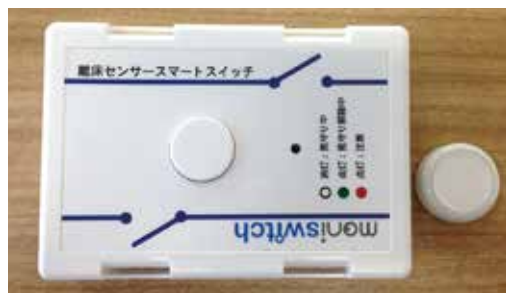
離床センサースマートスイッチ (moniswitch)

優れたソフトウェアの設計・開発力を生かしお客様の要望に沿ったシステムを開発します。製品開発では、センシング技術、在宅介護システムで社会に貢献します。