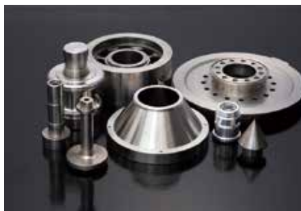
丸もの精密機械部品の加工