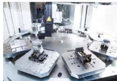
同時5軸加工機 10面パレット仕様