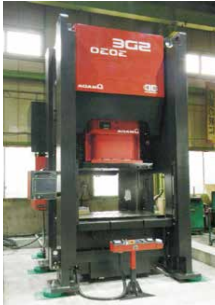
300トンサーボプレス

自動車シャーシ部品、機械用板金部品などの製造メーカーです。 プレス加工からアセンブリまで一貫生産を短納期で製作。