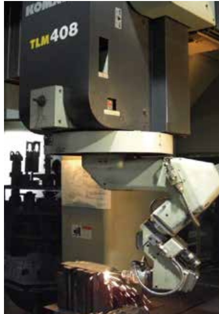
3次元レーザ加工機