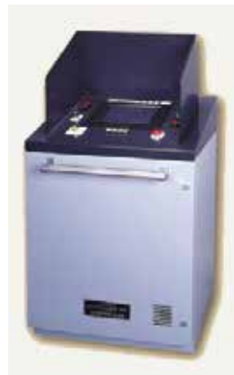
タッチパネル式バラスト制御装置

1905年の創業以来、船舶の安全運航を補助する「傾度計」「液面計」「バラスト制御システム」をご提案してきました。当社製品・システムを搭載している一般商船は世界で約3,000隻に上り、今後も造船・海運・海洋土木の分野で業界のニーズにお応えして参ります。