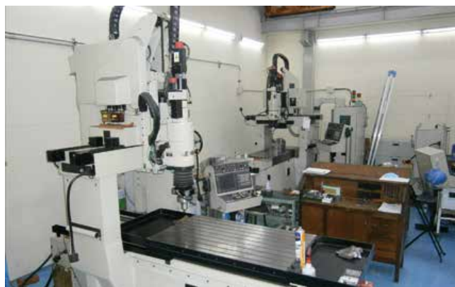
2台の門型CNCジグ研削盤

ジグ研削加工の認知度を上げる為、新しいジグ研削加工のご提案をする為に各地展示会に積極的に出展します。