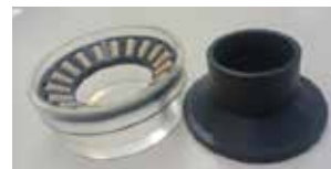
スラスト型樹脂ベアリング