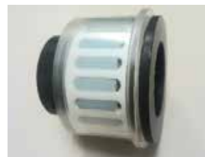
横型樹脂ベアリング