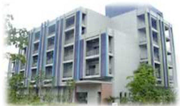
◆横浜新技術創造館(リーディングベンチャープラザ)外観