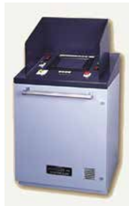
タッチパネル式バラスト制御装置

1905年の創業以来、船舶の安全運航を補助する「傾度計」「液面計」「バラスト制御システム」を御提案してきました。当社製品・システムを搭載している一般商船は世界で約3,000隻に上り、今後も造船・海運・海洋土木の分野で業界のニーズにお応えして参ります。