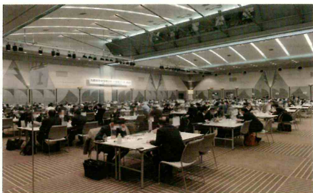
令和4年度に実施した「九都県市合同商談会2023」の商談風景 (会場:幕張メッセ コンベンションホール)

首都圏産業の国際競争力の強化を図るため、平成20年度から九都県市(埼玉県、千葉県、東京都、神奈川県、横浜市、川崎市、千葉市、さいたま市、相模原市)が連携して合同商談会を開催し、今回で16回目を迎えます。