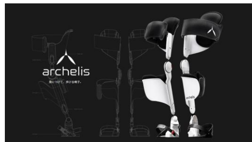
ウェアラブルチェア「アルケリス」