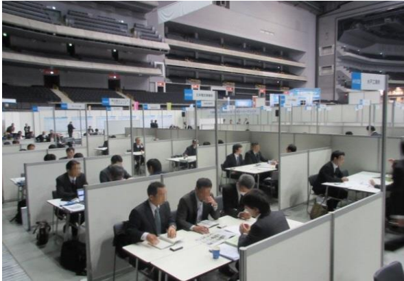
イメージ（昨年度の商談風景）

首都圏産業の国際競争力の強化を図るため、平成20年度から九都県市（埼玉県、千葉県、東京都、神奈川県、横浜市、川崎市、千葉市、さいたま市、相模原市）が連携して合同商談会を開催しています。