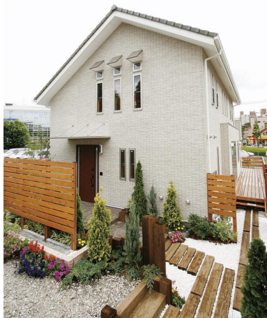
▲ 呼吸する家 外観

現在コストダウンを主としたバージョンIVモデルの設計が完了し、このモデルのパッケージ化を進めています。パッケージ化とは、設計や施工についての様々なノウハウを規格化したもので、全国各地のビルダーを介して「呼吸する家」の普及を促進するものです。またパッケージ化には、技術的要素だけでなく、販売促進のためのマーケティングの仕組みも含まれており、全国各地のビルダーとのネットワークを、今まで以上に強化・拡大していく予定です。