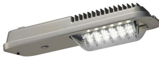
▲ LED 防犯灯