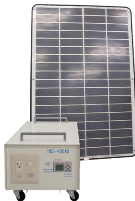
▲ 非常用蓄電池システム

また、最近では ECO、防災をテーマにした非常用蓄電池システムなどの新製品の開発にも力を注いでいます。この非常用蓄電池システムは、太陽光パネルと AC 電源から同時に充電が可能です。また、軽量（約 3kg）の太陽光パネルですので、設置も非常に容易で、あらゆる場面での非常用蓄電池として利用できます。