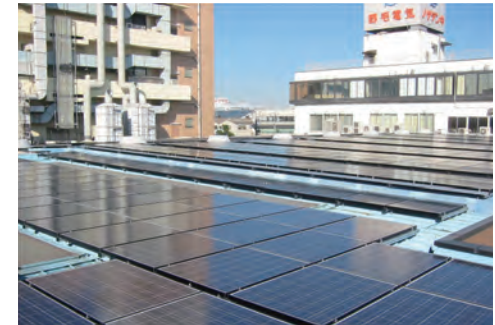
●100KWソーラー発電システム設置