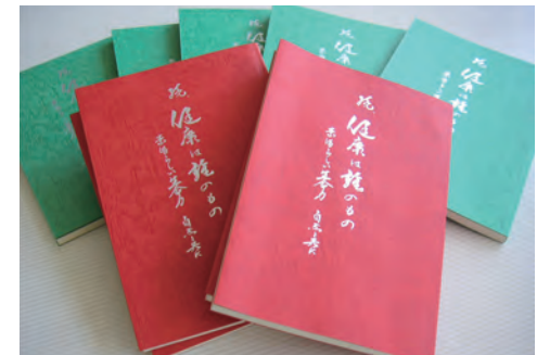
●相談役が著した健康読本