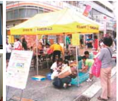
地元商店街の祭りへの参加