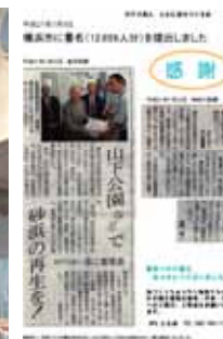
NPO とも浜における活動