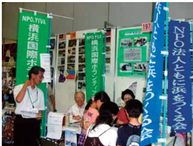
NPO とも浜をつくる会にて

同社の特徴的な取り組みとして、1つめはNPOとも浜の活動に参加及び寄附、2つめは建設業退職金共済組合に加入、3つめは関東学院大学に事務局の場所を無料提供、などがあげられます。