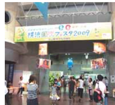
横浜国際フェスタ2009への参加