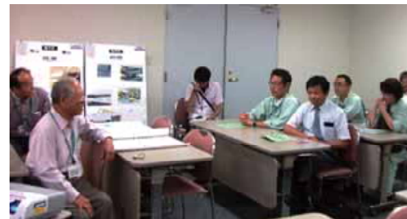
健康を語る会に参加