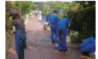
末広ファクトリーパーク 清掃活動