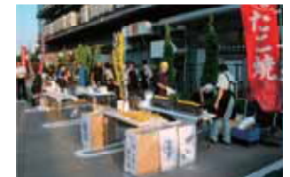
末広ファクトリーパーク納涼祭