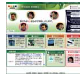
同社ホームページ