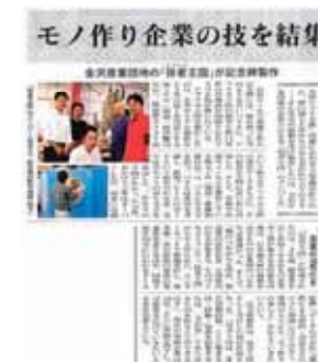
タウン誌での紹介記事