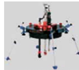
エアコン洗浄ロボット