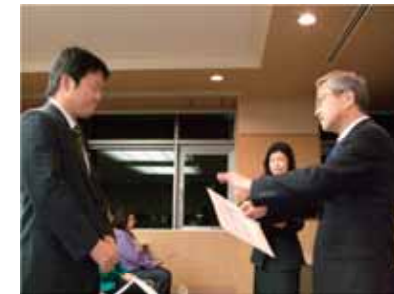
磯子区青少年指導委員委嘱状交付式