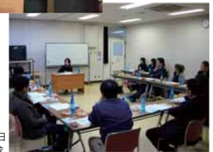
平成20年3月25日 第45回ハマカラ会