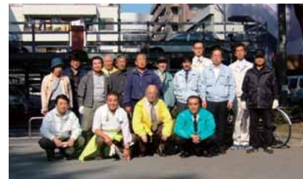
公園清掃活動に参加された皆さん