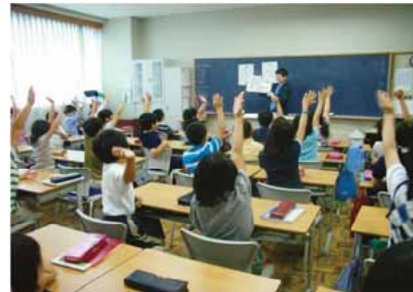
出前講師による授業の様子 全員手が上がっていますね！