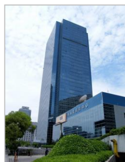
↑ 上海国際貿易中心のビル