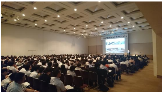
キックオフイベントの様子 (2017.6)