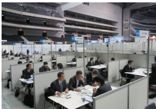
《昨年度商談風景より》

取引先の新規開拓のきっかけづくりや、新たなビジネスチャンス創出の機会として、埼玉県、千葉県、東京都、神奈川県、横浜市、川崎市、千葉市、さいたま市、相模原市の9都県市による合同商談会を開催いたします。