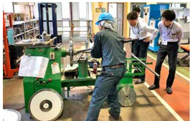
現場訪問による工場視察

こうした事例をまとめた「IDEC 横浜支援成果事例集」は、IDEC 横浜のウェブサイトからもダウンロードできますので、ぜひご参照ください。