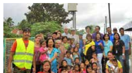
成約につながり設置したユニメーションシステム（磯子区）の河川警報システム

拓に取り組んできました。製品は、食品、繊維・日用品、機械、機械部品、環境、バイオ、IT・ソフトウェアと幅広く、また、