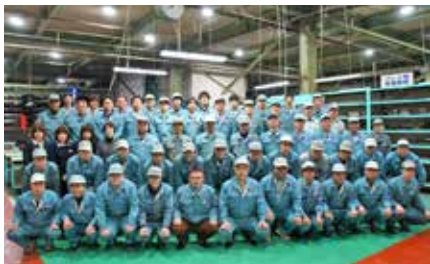
ガイド2017年度版と中込製作所（本文中掲載企業）

「横浜ものづくり企業ガイド」掲載の詳細・お申込み方法ははこちら http://www.idec.or.jp/renkei/guide/index.php